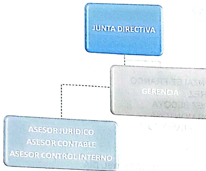
Figura 1. Organigrama institucional del Fondo de Desarrollo Social del Municipio de El Retiro —FONDESER—

La Junta Directiva está conformada por el alcalde municipal, el o la titular del despacho de la Secretaría de Hacienda, el o la representante de los grupos asociativos de vivienda, el o la representante de los industriales y microempresarios, el o la representante de los universitarios y el gerente de FONDESER, que funge como secretario de la Junta Directiva.